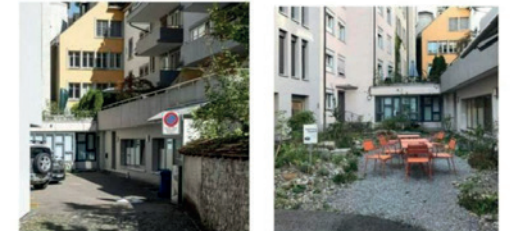
Bildlegende: Nachdem der Asphalt geknackt wurde, blüht es nach nur einem Jahr auf und es lässt sich verweilen im Innenhof.