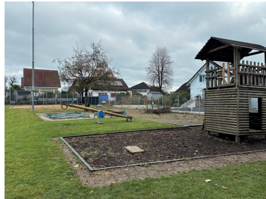
Alter Spielplatz vor dem Neubau: Die bestehende Anlage entsprach nicht mehr den heutigen Anforderungen und wird im Zuge des Projekts vollständig erneuert.

Mit der geplanten Umgestaltung wird der bestehende Spielplatz beim Schulhaus Andwil gezielt ergänzt und aufgewertet. Neue Bepflanzungen, zusätzliche Schattenbereiche und naturnahe Elemente schaffen künftig noch mehr Raum zum Spielen, Entdecken und Verweilen.